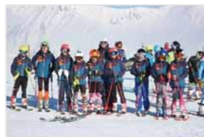
Podium Tout Schuss Cup aux 2 Alpes Garçons 2008 – Départ Léon Vitesse à l'Alpe – Groupe U12 JB Cup à Valloire

Tous les enfants ont découvert plein de disciplines différentes telles que le géant, le slalom, le super G, le saut sur tremplin et ski cross. Merci à nos entraîneurs.