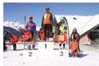
Buvette pendant les courses – Podium « Les étoiles d'Oz » filles 2012 – Ravitaillement pendant les courses – Podium Parallèle U12 Garçons

Nous remercions, tous les bénévoles présents sur les manifestations (Buvettes sur le front de neige pour les courses et vente de crêpes et vins chaud tous les mercredis pendant les vacances de Noël et Jour de l'An et les 4 semaines des vacances de février).