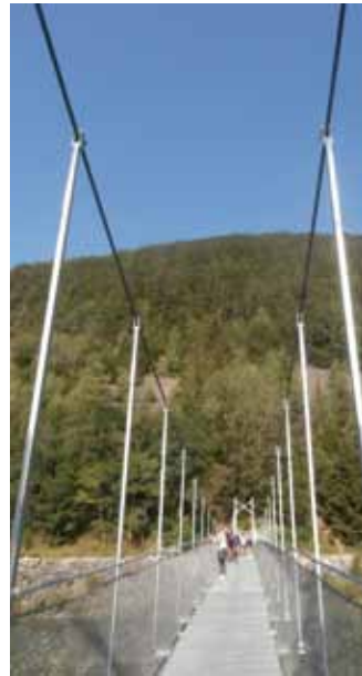
La Passerelle du Verney