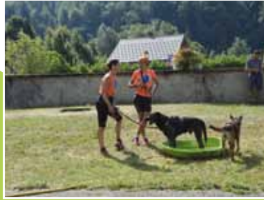
Canicross Trophée des Montagnes