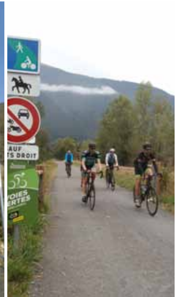
La Voie Verte