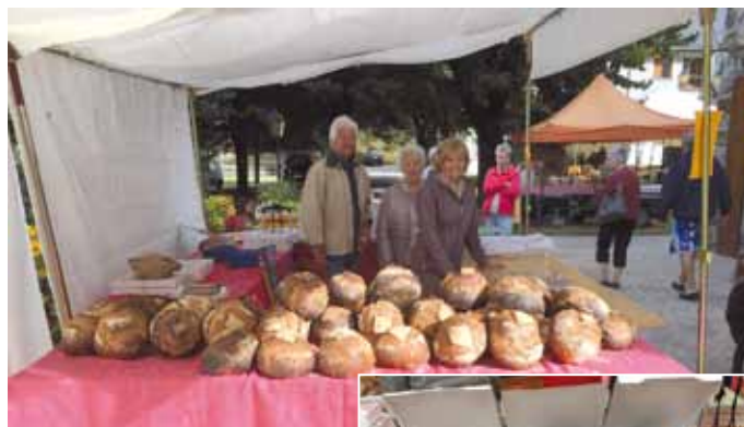
Fête du Pain du CCAS du 15 Août 2019