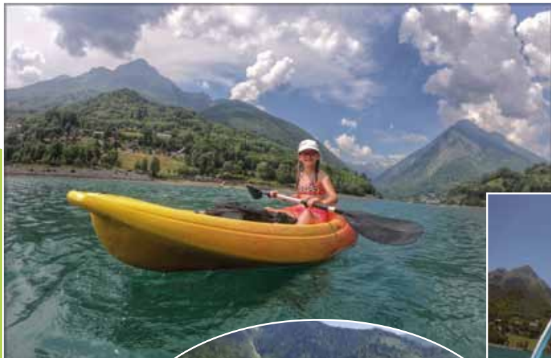
Base Nautique été 2019