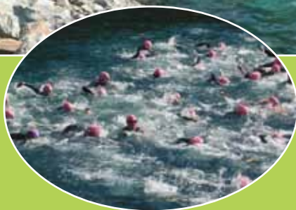
Départ du Triathlon 2019