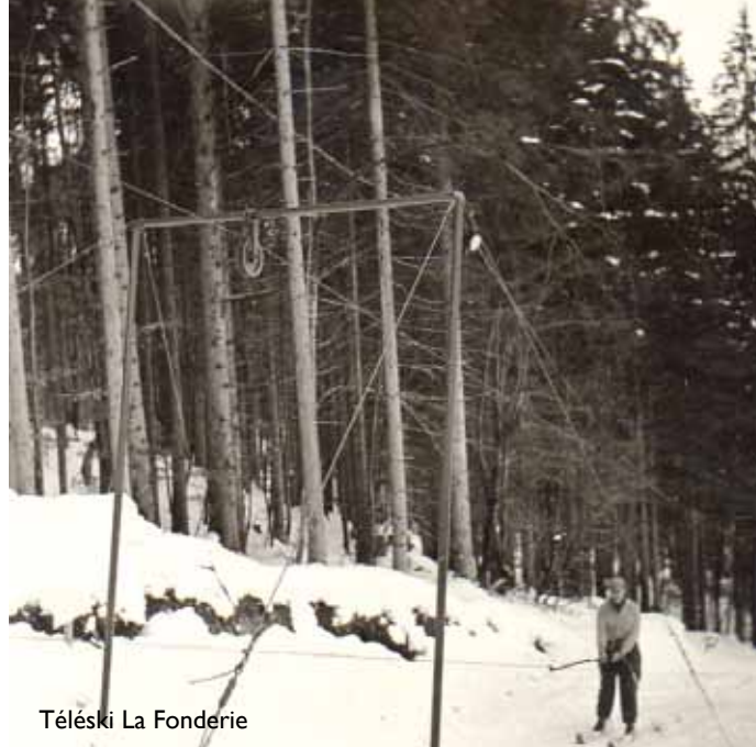
Téléski La Fonderie

Dans le même temps, à la fin des années 50, le Ski-club d'Allemont a acheté un téléski dit « crayonné ». Il n'y avait pas de béton ; pour assurer leur stabilité, les portiques étaient tenus par des câbles haubanés (fixés par des tiges enfoncés dans le sol), les perches étaient fixes (il fallait les attraper au vol). Démontable, il a été installé, d'abord à Champ Bâtard, puis aux abords de l'ancienne piscine.