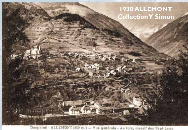
1930 ALLEMONT Collection Y. Simon