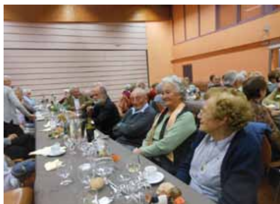
Repas des Têtes Blanches du mois d'octobre 2013