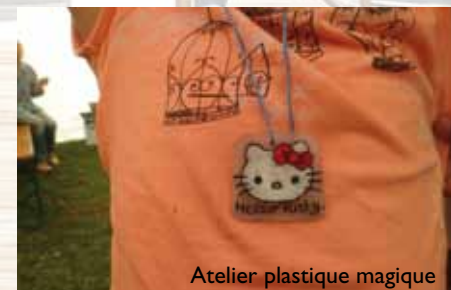
Atelier plastique magique