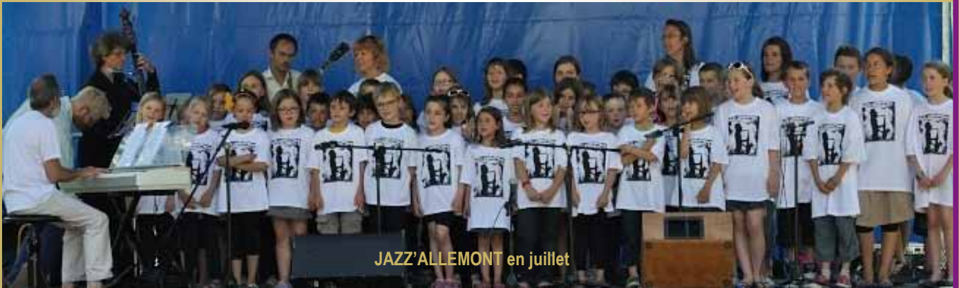
JAZZ'ALLEMONT en juillet