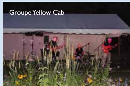
Groupe Yellow Cab