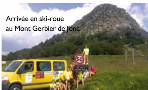
Arrivée en ski-roue au Mont Gerbier de Jonc

Le deuxième, aux Plans d'Hottonnes, était ouvert à partir des catégories qui intégreront les classes sportives du collège de Bourg d'Oisans, un