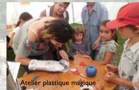
Atelier plastique magique