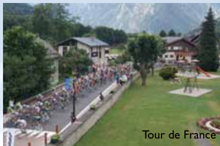
Tour de France