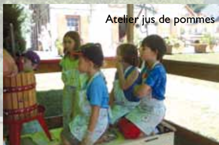
Atelier jus de pommes