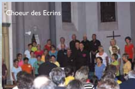
Choeur des Ecrins