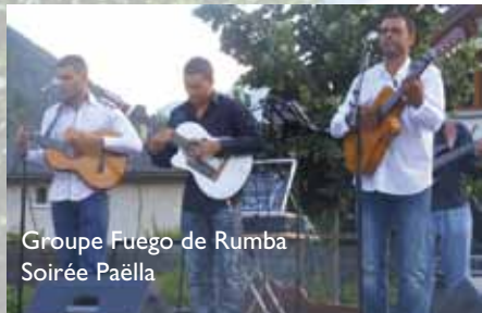
Groupe Fuego de Rumba Soirée Paëlla