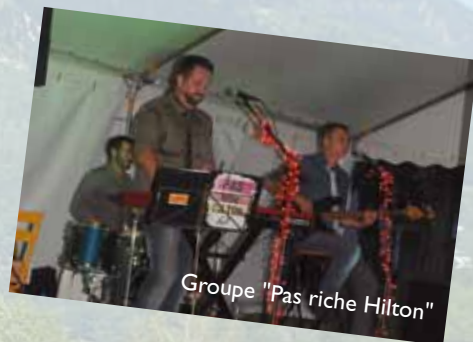
Groupe "Pas riche Hilton"