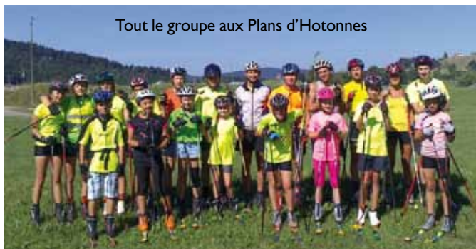
Tout le groupe aux Plans d'Hottonnes

lieu idéal pour nos 21 athlètes en maillot fluo : piste de ski-roue adaptée, et grandes prairies pour la course à pied et les séances de renforcement musculaire.