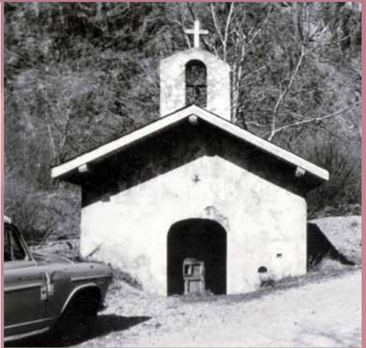
Chapelle de Bâton - avant rénovation (Merci à Andrée Duclot pour la photo et à Odile Verney.)